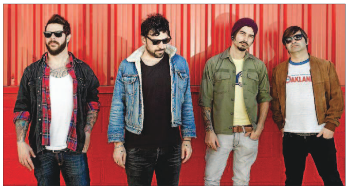
La banda mallorquina L.A., en una imagen promocional.

Grabado en la Serra de Tramuntana, en un entorno natural rodeado de robles y encinas -de ahí su título-, Luis Alberto Segura necesitaba escapar de la ciudad y de este año tan complicado para dar a luz sus nuevas criaturas. El resultado no podía haber sido más satisfactorio, el propio artista confiesa haber vivido el proceso crea-