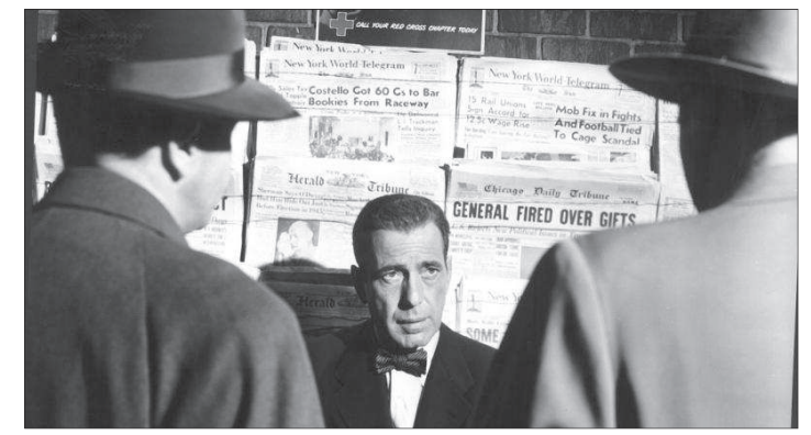
Fotograma de 'El cuarto poder', de Richard Brooks, que inicia hoy este ciclo en CineCiutat.

El 29 abril se proyectará El gran carnaval, otro clásico de Billy Wilder, de 1951,